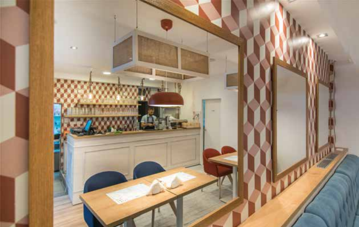
Baloro Poslastičarnica, Beograd, 130m 2 , 2017.