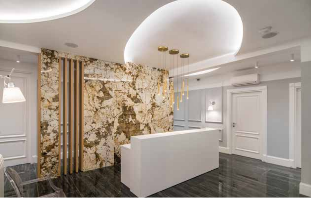
Skinmedic Clinic, Beograd, 300m2, 2019.