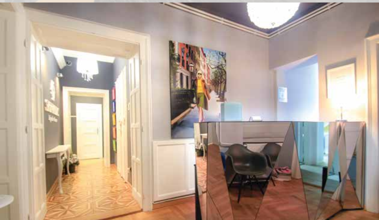
Skinmedic Clinic, Beograd, 20m2, 2016.