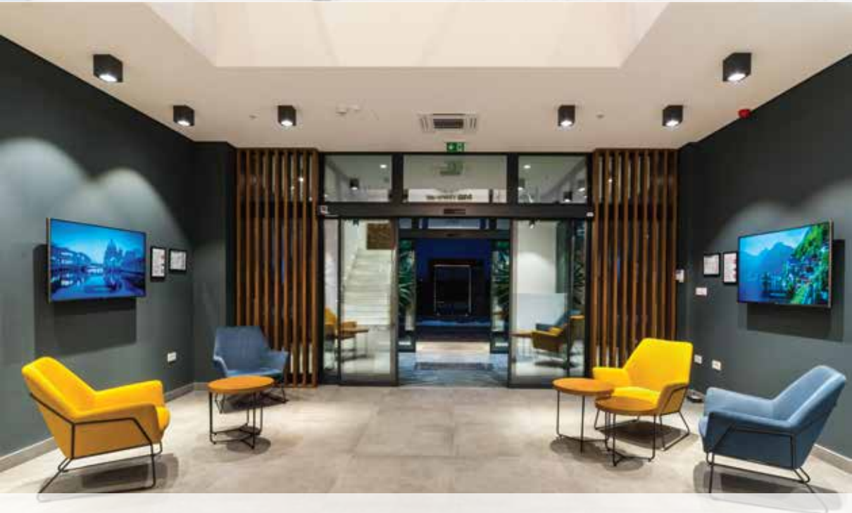
M&B Trans Upravna zgrada, Indija, 1200m2, 2018.