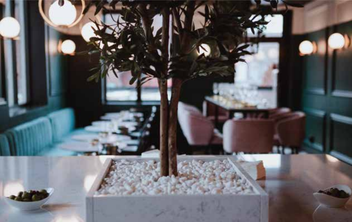
Miss F, Geteburg, Švedska, 95m 2 , 2018.