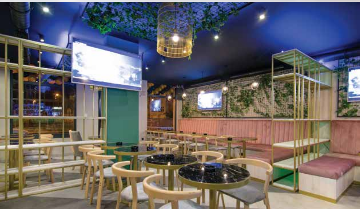
Kvant Coctail Bar, Beograd, 80m 2 , 2019.