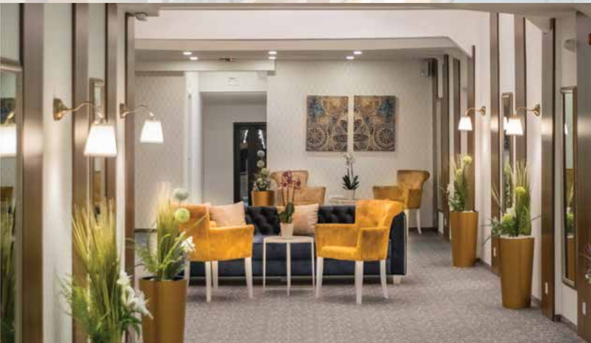
Apartmani Velika Skadarlija, Beograd, 950m 2 , 2019.